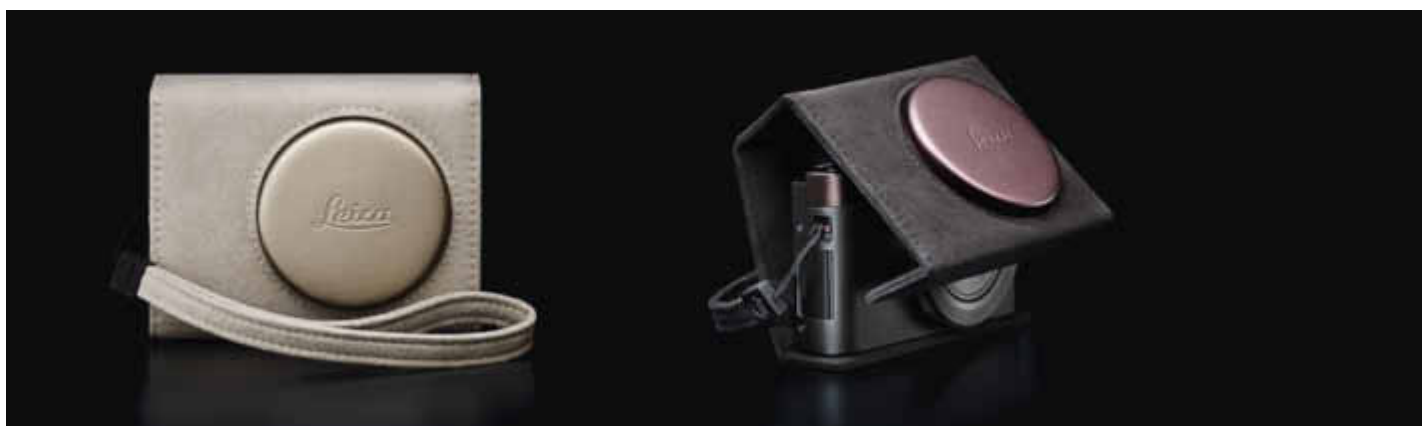
LEICA C Twist: light gold Prix de vente recommandé: CHF 105.–