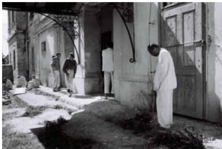
L'état de l'hôpital psychiatrique en Roumanie était si indigne humainement qu'aucun journal n'a voulu publier les photos.