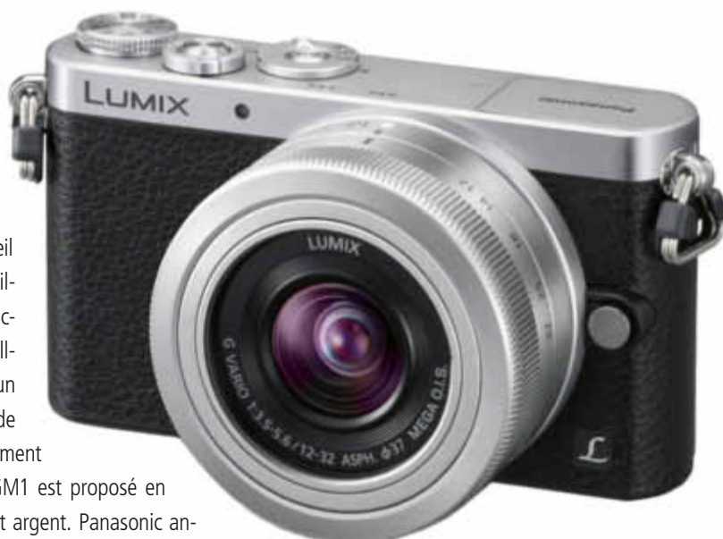
Lumix GM1 avec Vario 3,5–5,6/12–32 mm: Prix de vente probable: CHF 990.–

1 036 000 pixels. L'appareil dispose par ailleurs des fonctions WiFi et Full-HD. Equipé d'un zoom grande angle extrêmement lumineux, le GM1 est proposé en versions noir et argent. Panasonic annonce par ailleurs de nouveaux objectifs interchangeables en standard micro 4/3 – dont le LEICA DG SUMMILUX 15 mm/F1.7 ASPH.