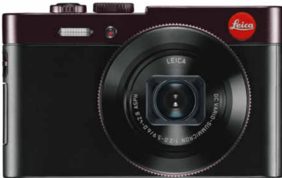
LEICA C: Prix de vente recommandé: CHF 785.–

Technique, design et accessoires: le nouveau LEICA C combine un équipement haute performance avec beaucoup de style et des accessoires innovants.