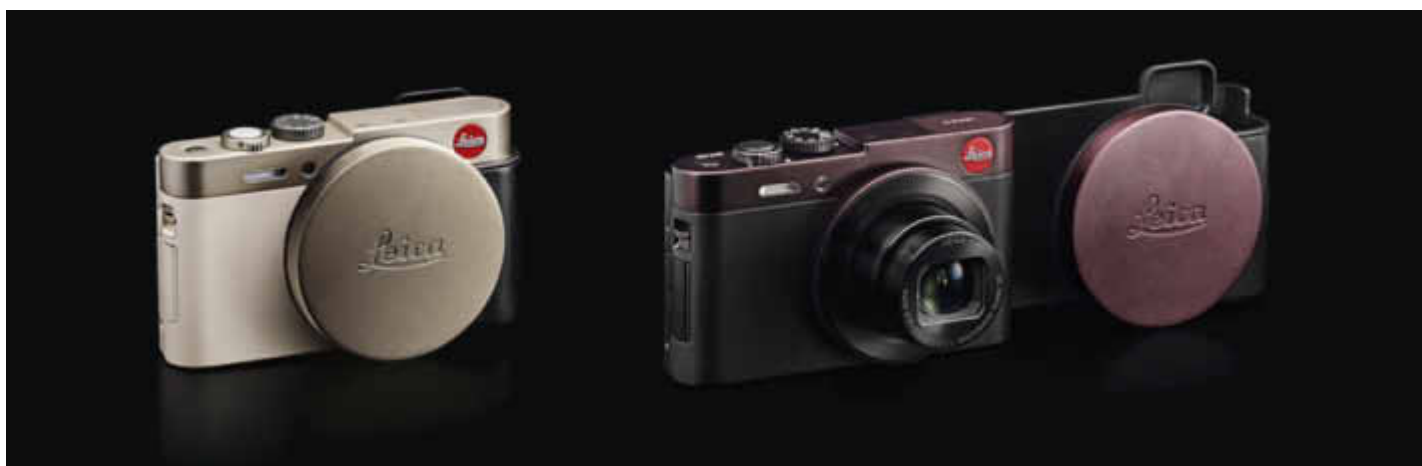
LEICA C Snap: light gold Prix de vente recommandé: CHF 78.–