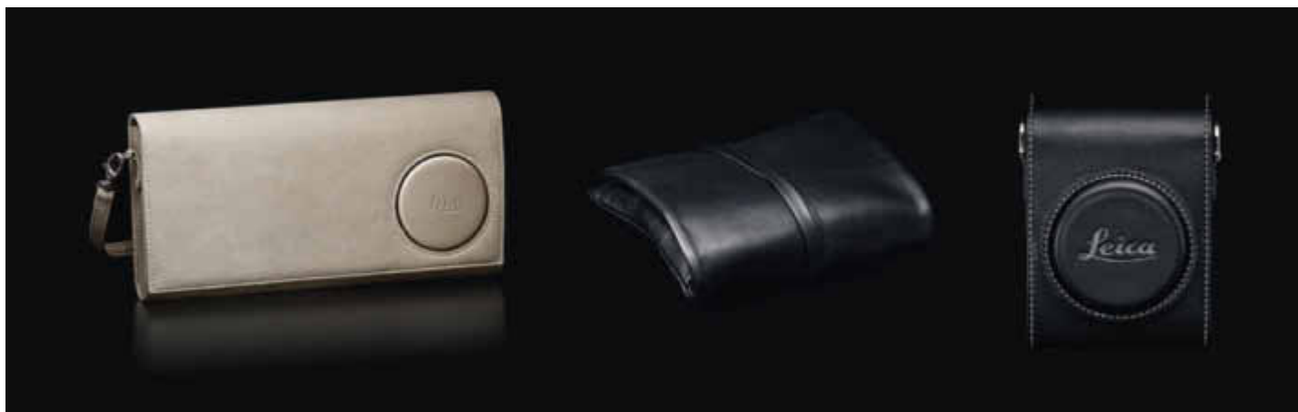
LEICA C Clutch: light gold oder dark red Prix de vente recommandé: CHF 145.–