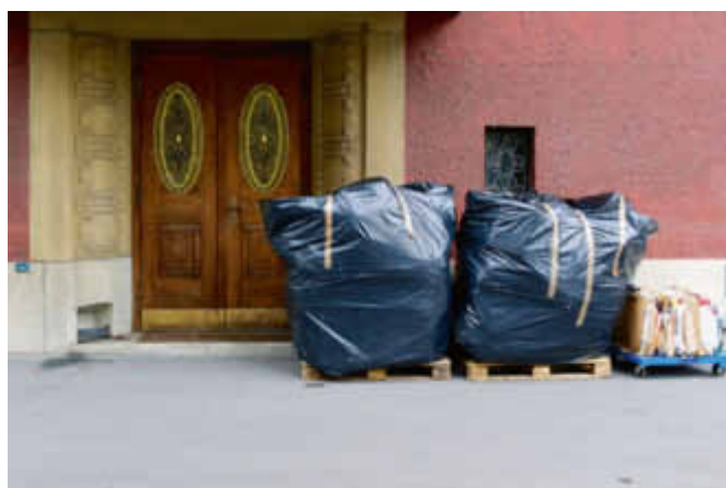
Cette série de photos a été prise par Reeto von Gunten avec un Leica X Vario: «La qualité d'image est absolument convaincante – comme avec tous les Leica.»

riences avec les images animées il y a sept ans déjà et continue de les développer constamment. Au début, il ne s'agissait que de courtes séquences projetées avant ses shows de diapos. Aujourd'hui, le film compose plus de la moitié du spectacle. Il ajoute avec le sourire que «la prochaine étape serait un long-métrage de cinéma».