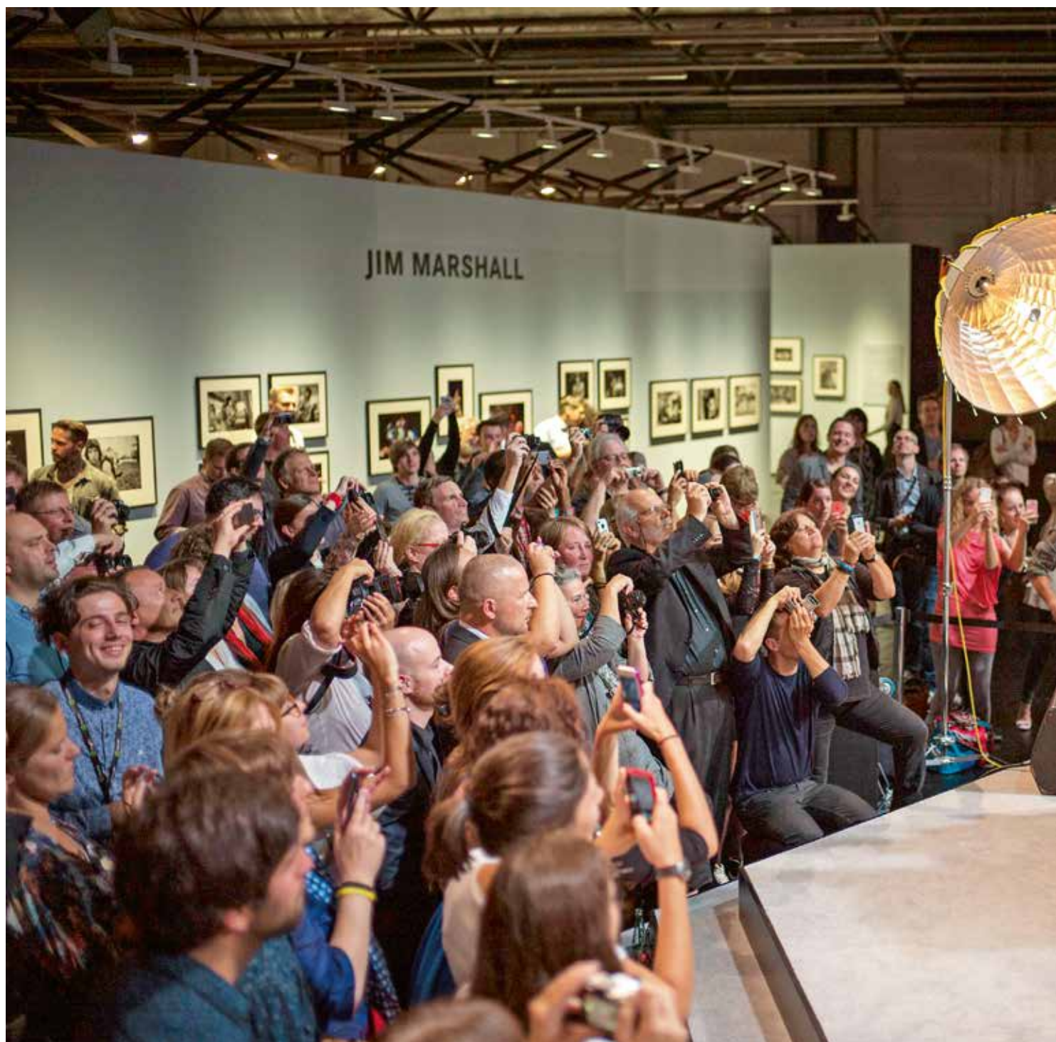
Au plus près de l'action: lors du mini-concert de Jamie Cullum, le public était à touche-touche avec le chanteur anglais.

Environ mille invités ont assisté à la Photokina à Cologne à la fête de jubilé donnée par Leica à l'occasion du 60 e anniversaire du système Leica M. Le chanteur britannique Jamie Cullum y a interprété en live plusieurs morceaux de son dernier album «Interlude». Quant au photographe mondialement célèbre Thomas Hoepker, il s'est vu décerner le Leica Hall of Fame Award pour l'ensemble de son œuvre.