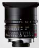
p.ex. Leica 1:3.8-Elmar-M-ASPH. 24 mm

Objectif de votre choix* ( parmi toute une gamme de modèles proposés):