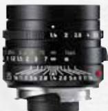
p.ex. Leica 1:1.4 Summilux-M ASPH. 35 mm