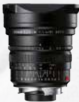
p.ex. Leica 1:1.4 Summilux-M ASPH. 21 mm